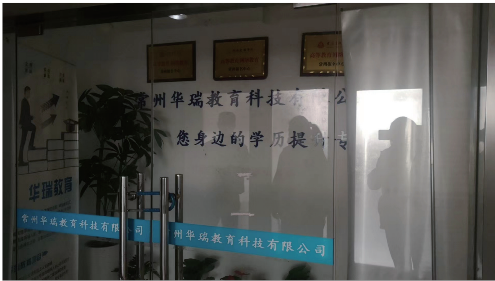
3月1日，常州华瑞教育科技有限公司无人办公，大门被锁上。