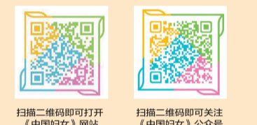
扫描二维码即可打开《中国妇女》网站 扫描二维码即可关注《中国妇女》公众号